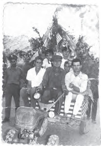
Desfilando en las fiestas patronales