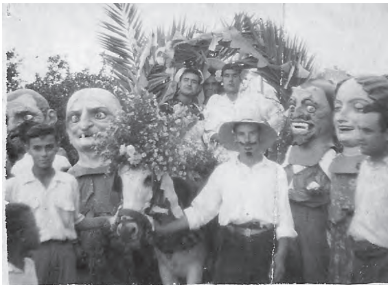
Gigantes y cabezudos. 1957