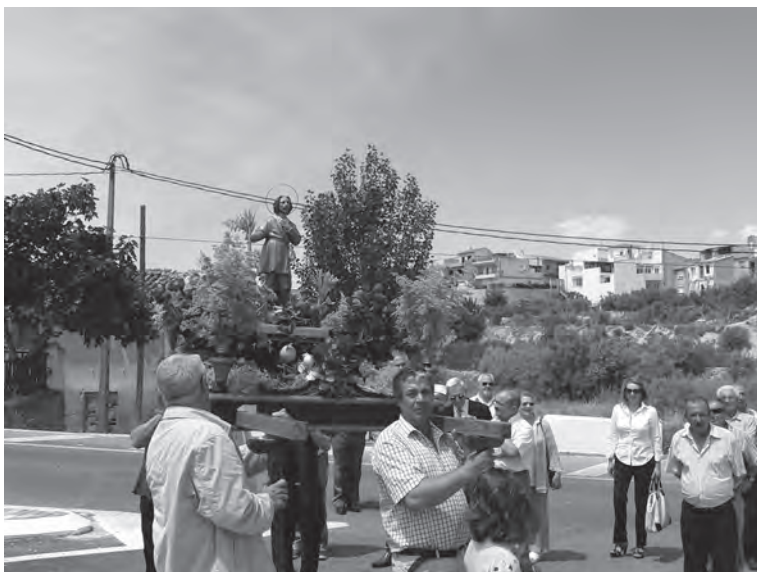
Procesión de san Isidro