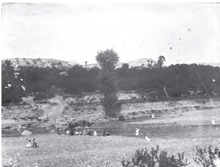
Lavando en el río Mula