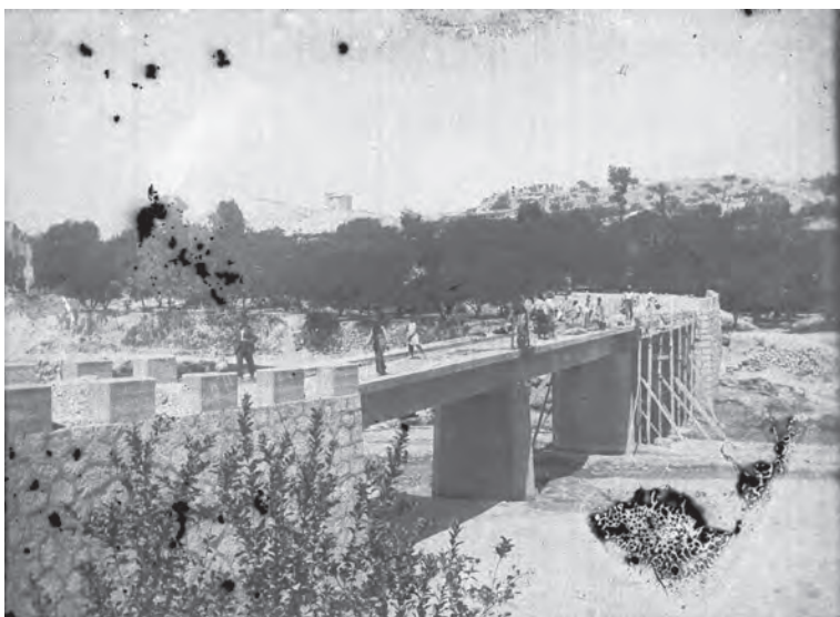
Construcción del puente sobre el río Mula