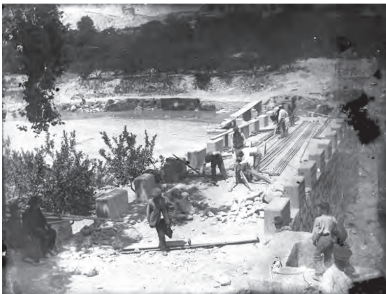
Construcción del puente al Laero