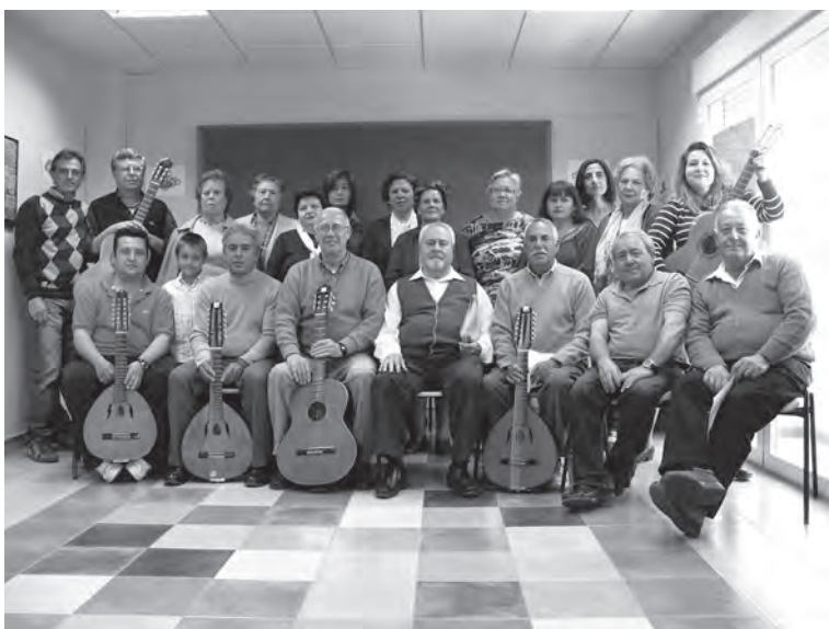
Coral Virgen de los Remedios