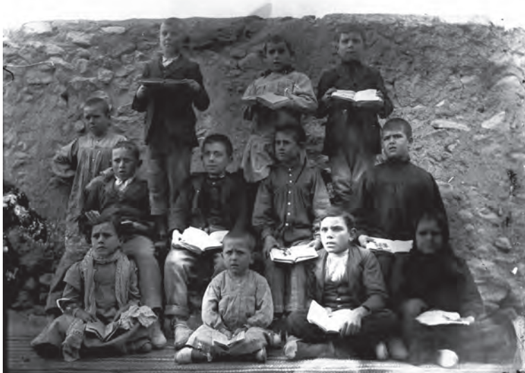
En la escuela