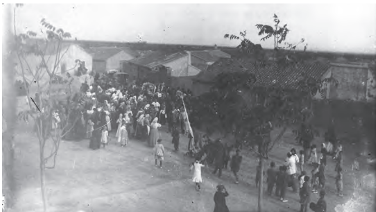
Entierro de un niño