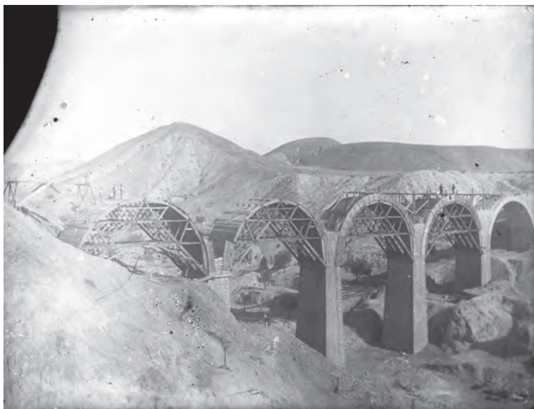
Construcción del puente para el ferrocarril