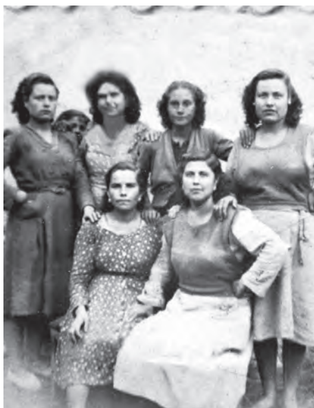
Grupo de amigas. Años cincuenta