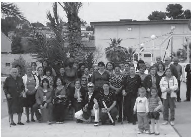
Día de la Mujer