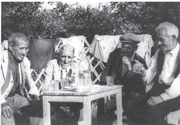
Taberna del Tío Riao, Barrio de la Cruz