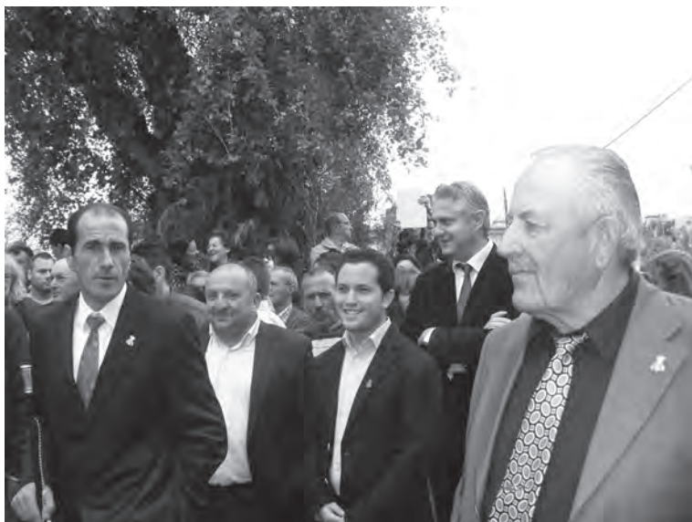
Alcaldes de Ramos