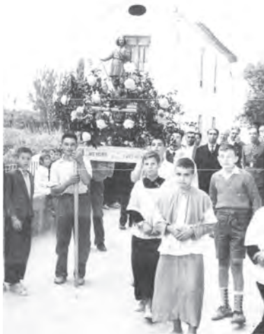
San Isidro, delante de las antiguas escuelas. 1956