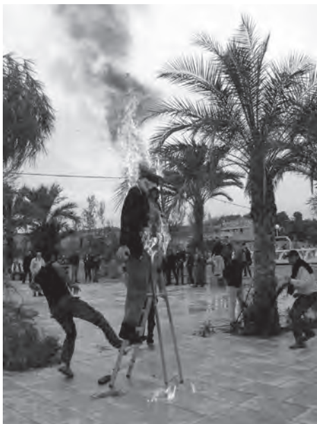
Quema de Judas. Tradición única en la región.