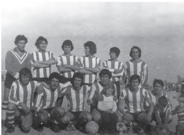
Equipo de fútbol