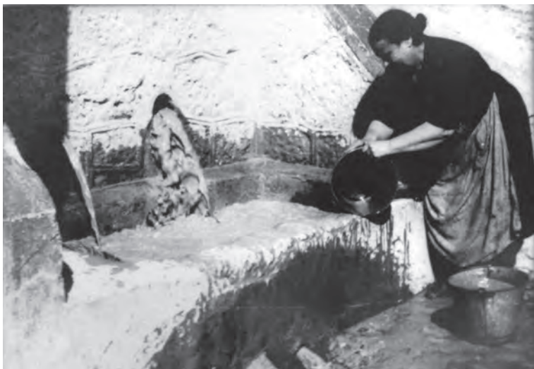
La Pila, años cuarenta