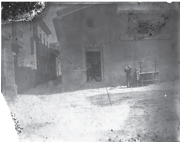
Sede del Sindicato Católico Agrario. 1918. Casa del Cura actual