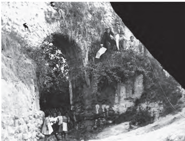
Ceña del Gaidón