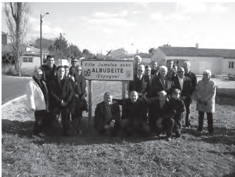
Albuiteros en Francia