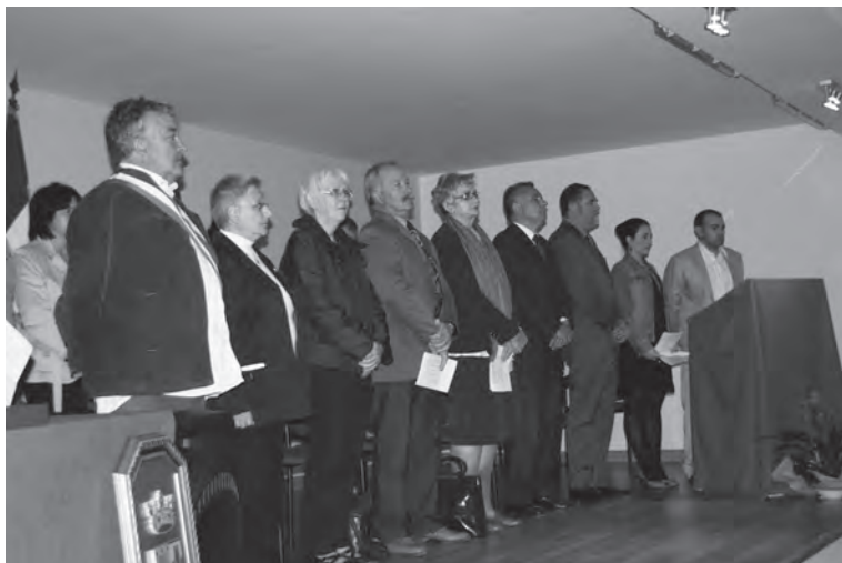
Acto institucional del Hermanamiento