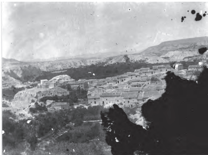
Vista de Albudeite años veinte