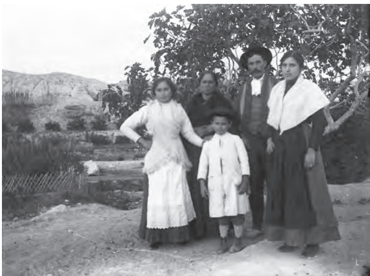
En la huerta. Al fondo podemos ver una noria