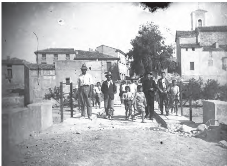
Sobre el puente. Años treinta