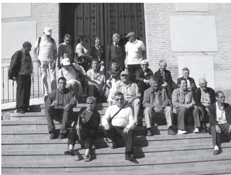
Franceses en Albudeite