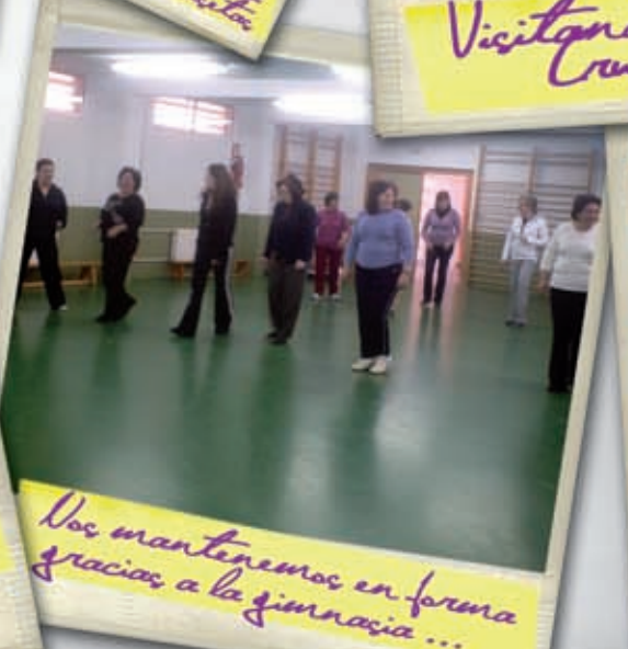
Nos mantenemos en forma gracias a la gimnasia ...