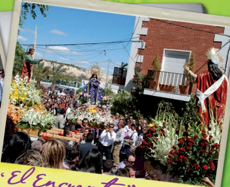
"El Encuentro" siempre nos llena de emoción