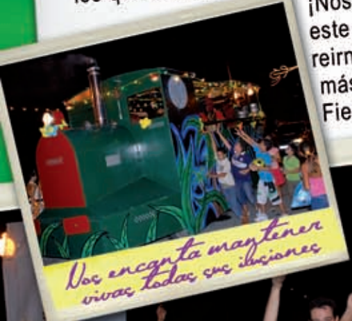
Nos encanta mantener vivas todas sus ilusiones