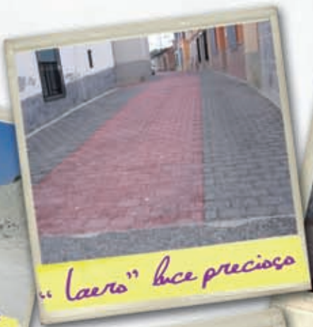
"Laero" luce precioso