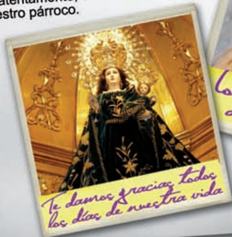
Te damos gracias todos los días de nuestra vida

Os saluda atentamente, deseándoos felices fiestas, vuestro párroco.