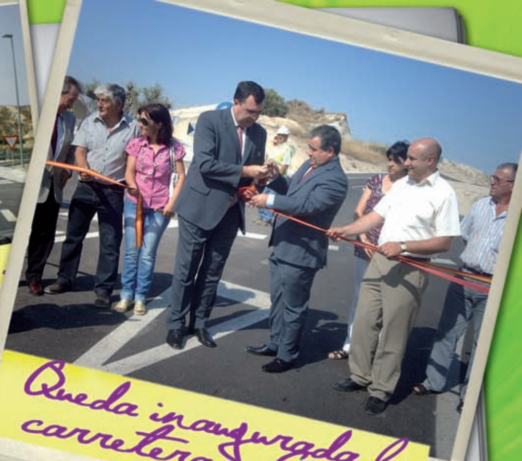
Queda inaugurada la carretera a Campos