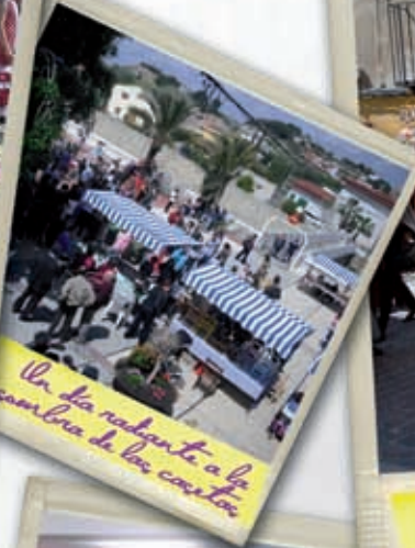
Un día radiante a la compra de los castors