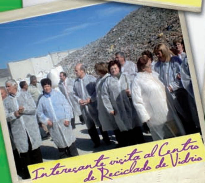
Interesante visita al Centro de Reciclado de Vidrio