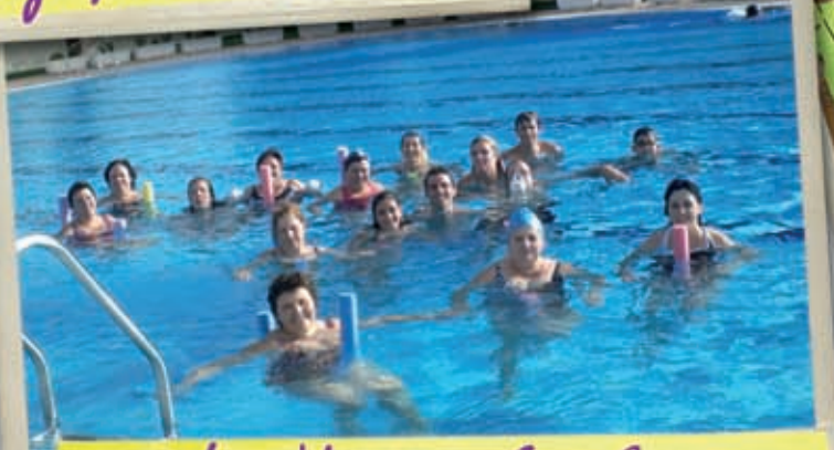
... Y en Verano también pero mucho más fresquitas