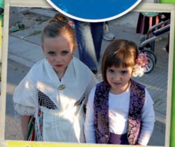
Ellos también la viven