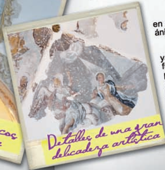
Detalles de una gran delicadeza artística