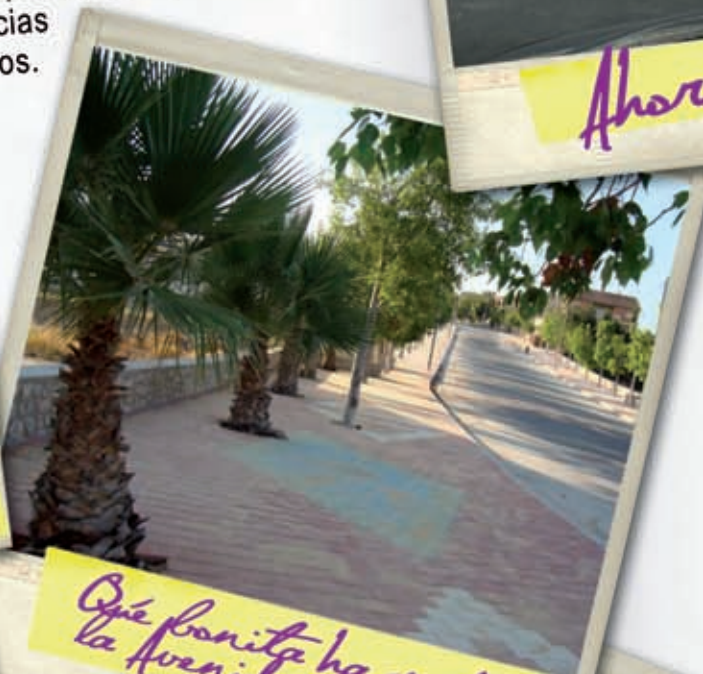
Qué bonita ha quedado la Avenida de la Paz