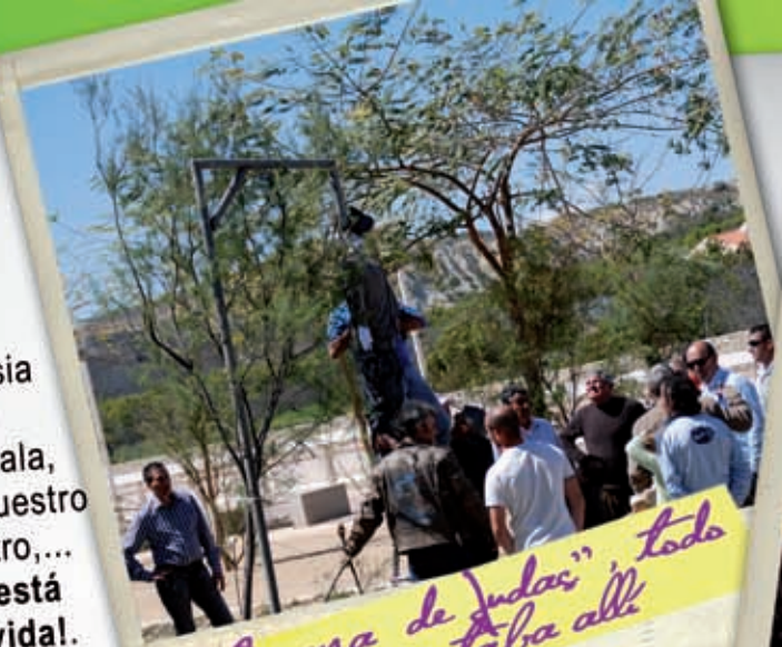
"La Quemada de Judas" todo el pueblo estaba allí