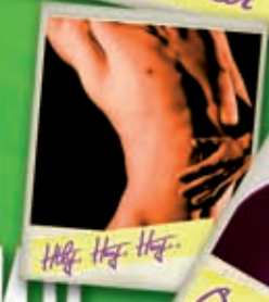
Hot Hot Hot