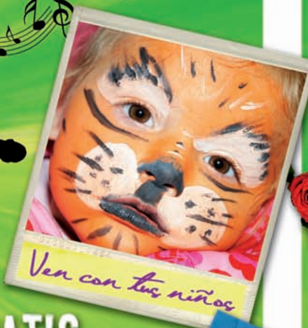
Ven con tus niños