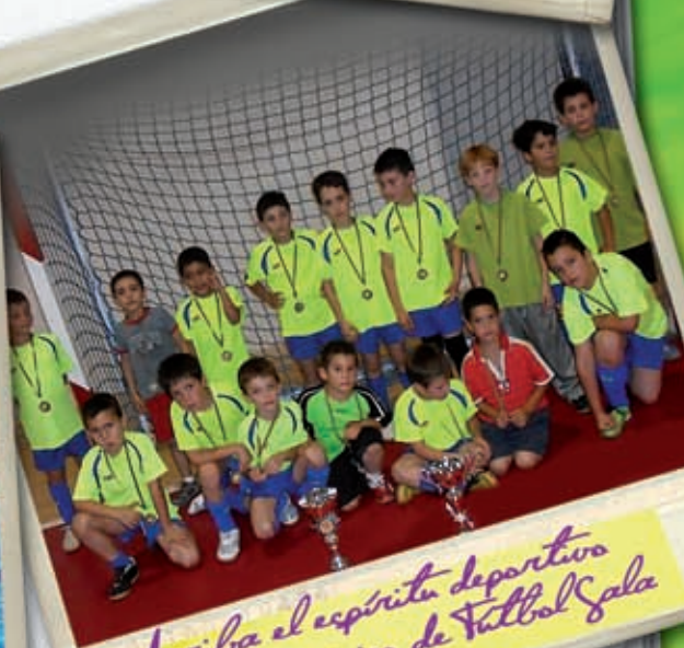
Arriba el espíritu deportivo y nuestro equipo de Fútbol Sala