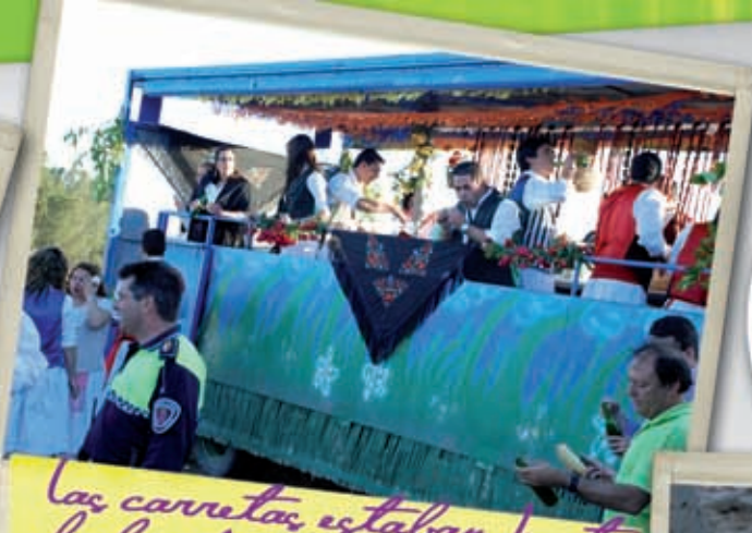
Las carrozas estaban hasta la bandera de Albudeiteros