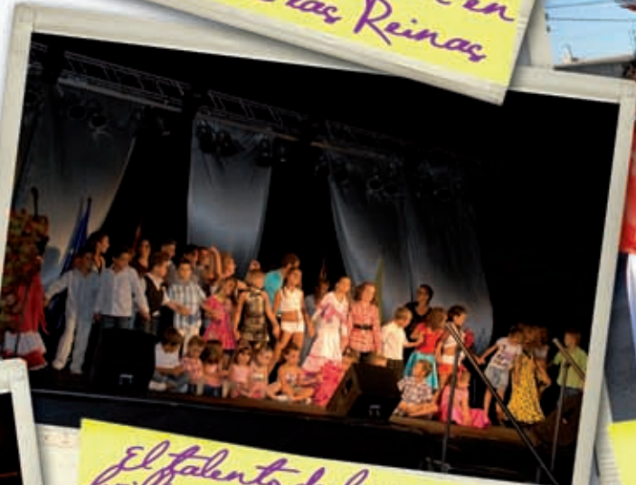
El talento de los "peques" brilló como nunca esa noche