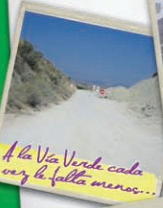
A la Vía Verde cada vez le falta menos...