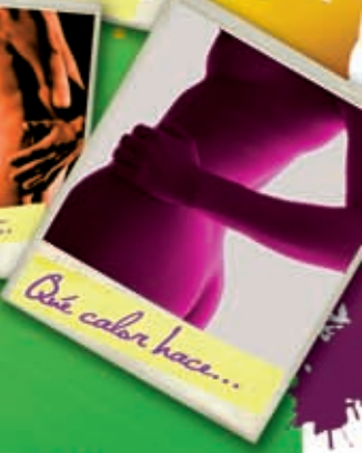
Qué calor hace...