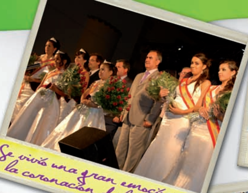
Se vivió una gran emoción en la coronación de las Reinas

¡Nos vemos este año para reírnos mucho más, Felices Fiestas 2010