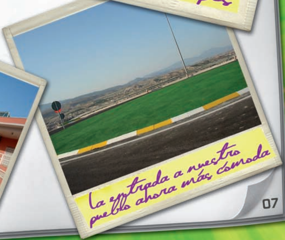
La entrada a nuestro pueblo ahora más cómoda