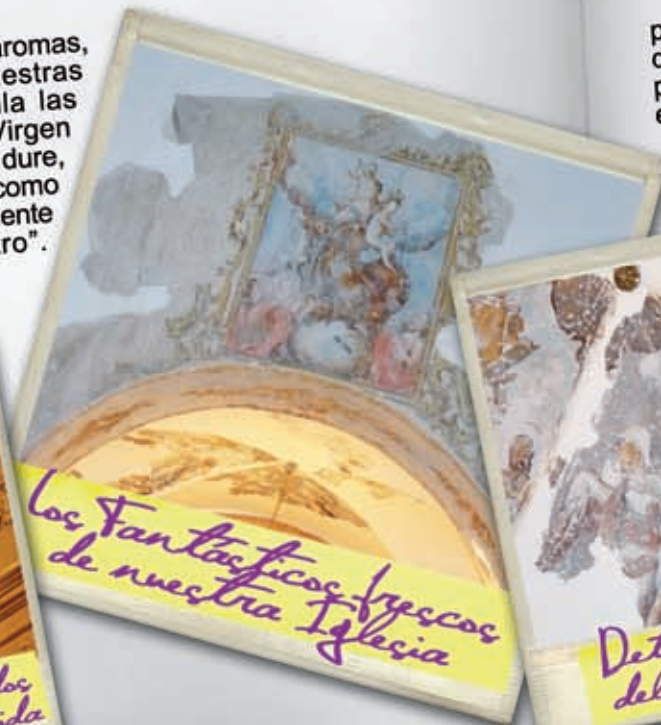
Los fantásticos frescos de nuestra Iglesia