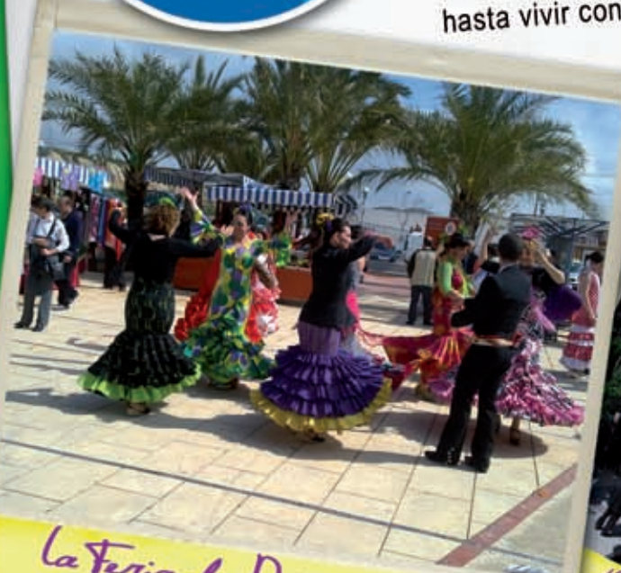
La Feria de Día nos contagió su gran alegría, ¡Ole!

Este año no hemos parado, desde la Feria de Día con sus bailes y su música, las visitas culturales, los cursos de gimnasia y natación, las citas deportivas con nuestro equipo de Fútbol Sala, hasta vivir con gran emoción nuestro querido Encuentro, ... ¡Albudeite está llena de vida!