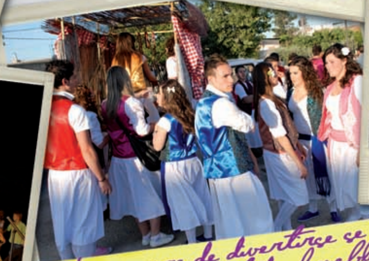
Las ganas de divertirse se apoderaron de todo el pueblo