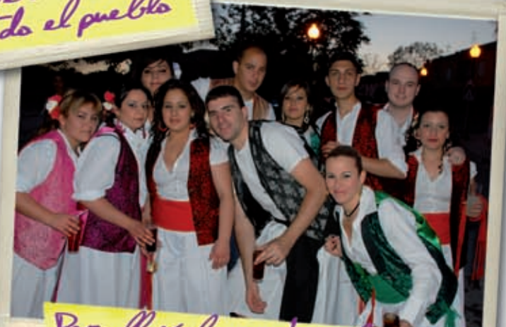
Pero llegó la noche y la gente quería seguir pasárselo bien

Todo el pueblo salió a la calle para disfrutar del buen tiempo y de la ilusión compartida con los vecinos, hasta los "peques" de la casa se sumaron a la fiesta de SAN ISIDRO como siempre muy esperada, otro año más desbordó alegría y muy buen rollo, Albudeite es lo más grande.