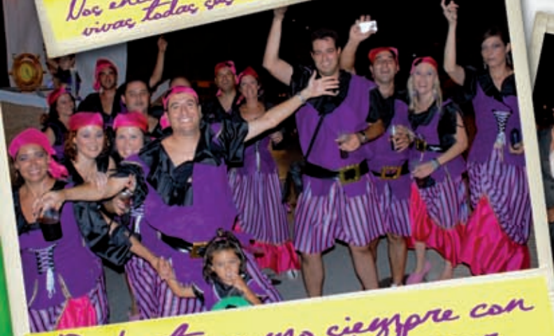
Disfrutar como siempre con buen sentido del humor