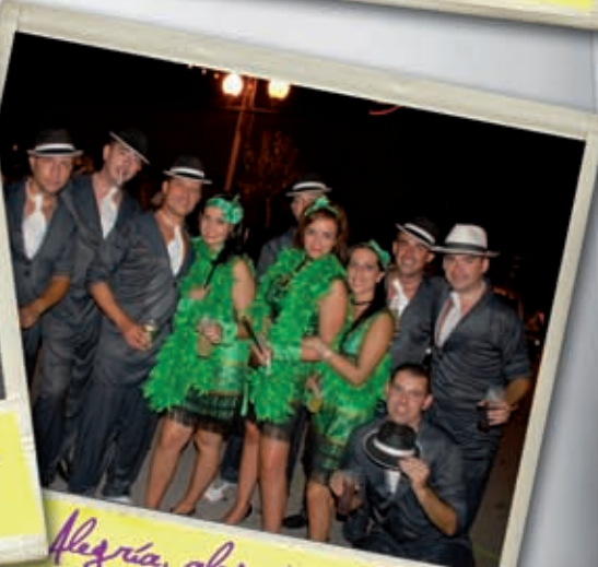
Alegría, alegría y alegría!