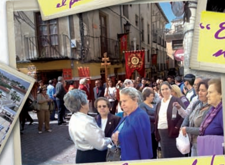
Visitando Carayaca de la Cruz para la procesion