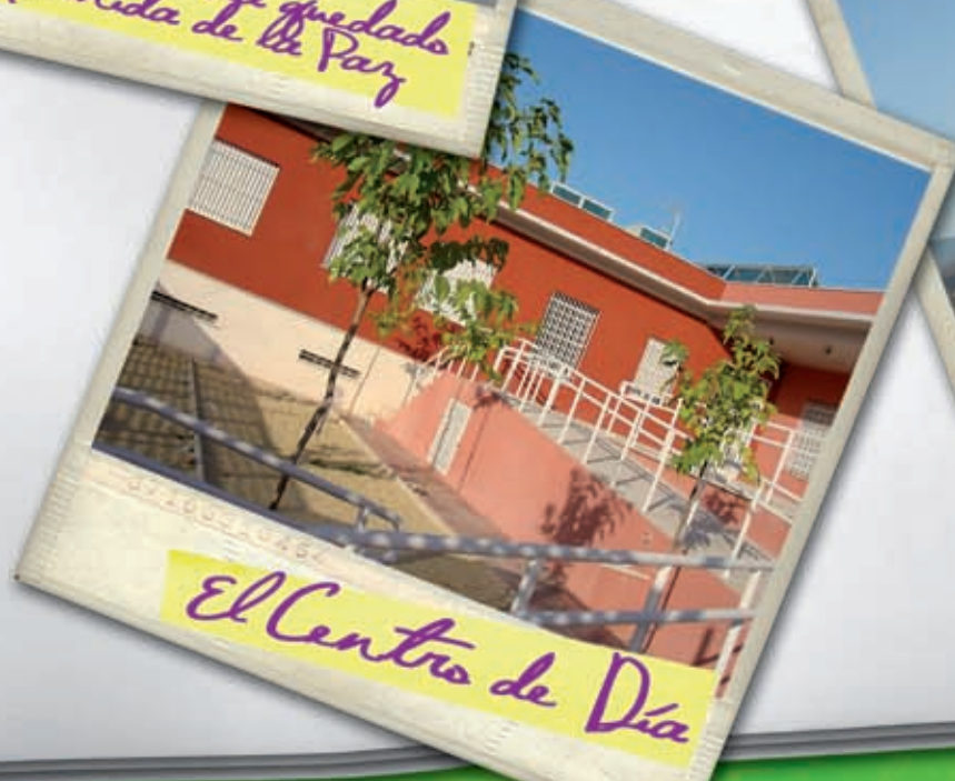
El Centro de Día