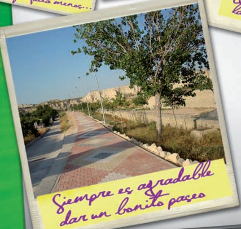
Siempre es agradable dar un bonito paseo