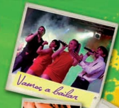
Vamos a bailar